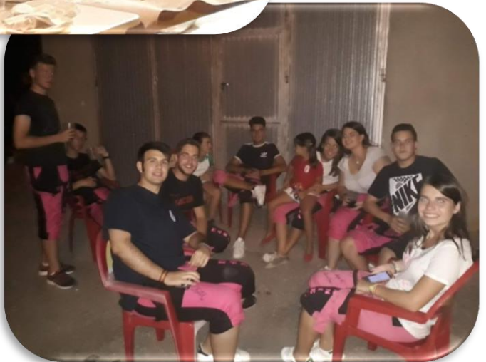
FIESTAS DE VALSECA | 2019