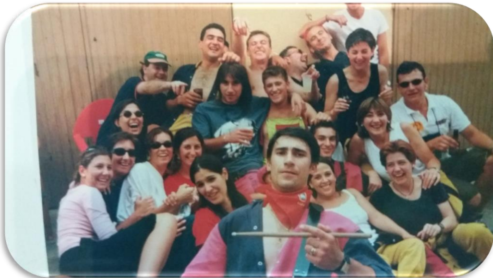
FIESTAS DE VALSECA | 2019